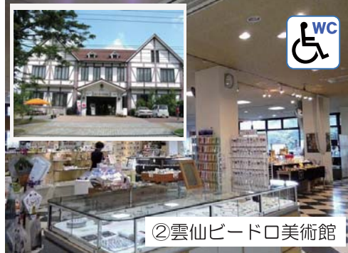
②雲仙ビードロ美術館

「ビードロ」と呼ばれてきた江戸期の吹きガラスや19世紀のボヘミアンガラスなどのアンティークガラスのコレクションがご覧になれます。また柿右衛門・鍋島・古伊万里などの陶磁器、絵画などを季節に応じて展示されています。(有料)