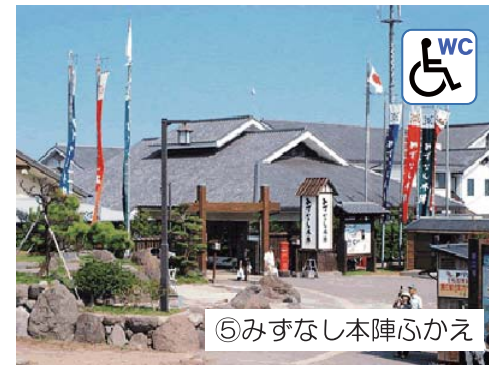
⑤みずなし本陣ふかえ

観光島原のシンボルである島原城は、キリシタン資料を中心とした総合的な郷土史料博物館です。天守閣はキリシタン史料館として島原の乱にまつわる数多くの史料を展示しており、西望記念館は日本彫塑界の巨匠で文化勲章を受賞した郷土出身の芸術家北村西望氏の代表作を展示している施設です。