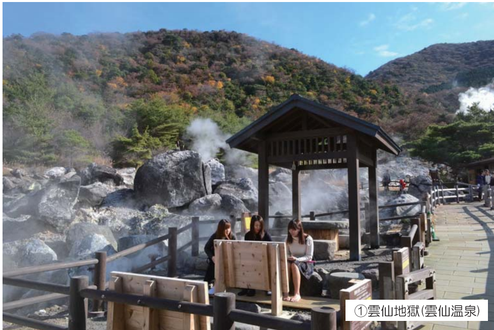
①雲仙地獄(雲仙温泉)

雲仙温泉を代表する観光名所。大叫喚地獄やお糸地獄、清七地獄など30あまりの地獄からなるキリシタン殉教の舞台です。※足を置くと地熱や噴気を体感できる休憩所「雲仙地獄 足蒸し(あしむし)」や温泉卵が楽しめます。