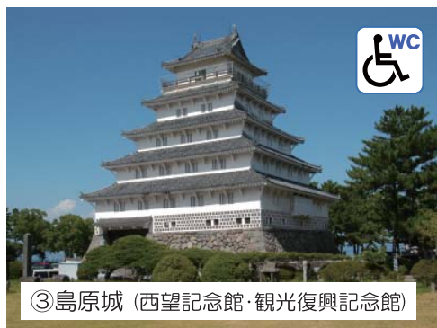
③島原城 (西望記念館・観光復興記念館)