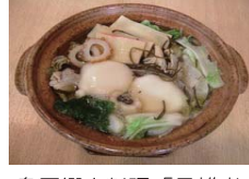
島原郷土料理「具雑煮」

お食事処やおみやげ物屋の他に、観光案内所があり、施設内には「土石流被災家屋保存公園」として雲仙普賢岳噴火で被災した家屋が保存されています。郷土料理や「海の幸」「山の幸」が楽しめます。