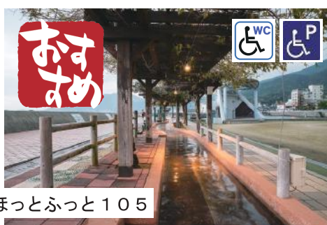
日本一なが〜い足湯 ほっとふっと105

雲仙市にある小浜温泉。九州を代表する名湯の一つです。「ほっとふっと105」は、105mという日本一の長さを誇る「足湯」スポットです。豊富な湯量は「湯棚」と呼ばれる源泉からお湯が降りていく間に適温となり、そのまま足湯へと流れ込んでいます。