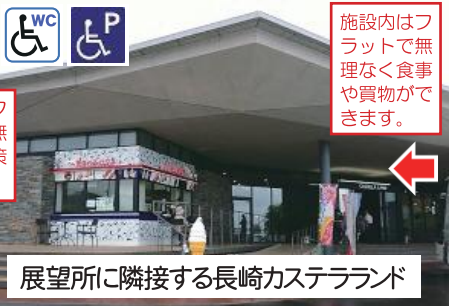
展望所に隣接する長崎カステラランド