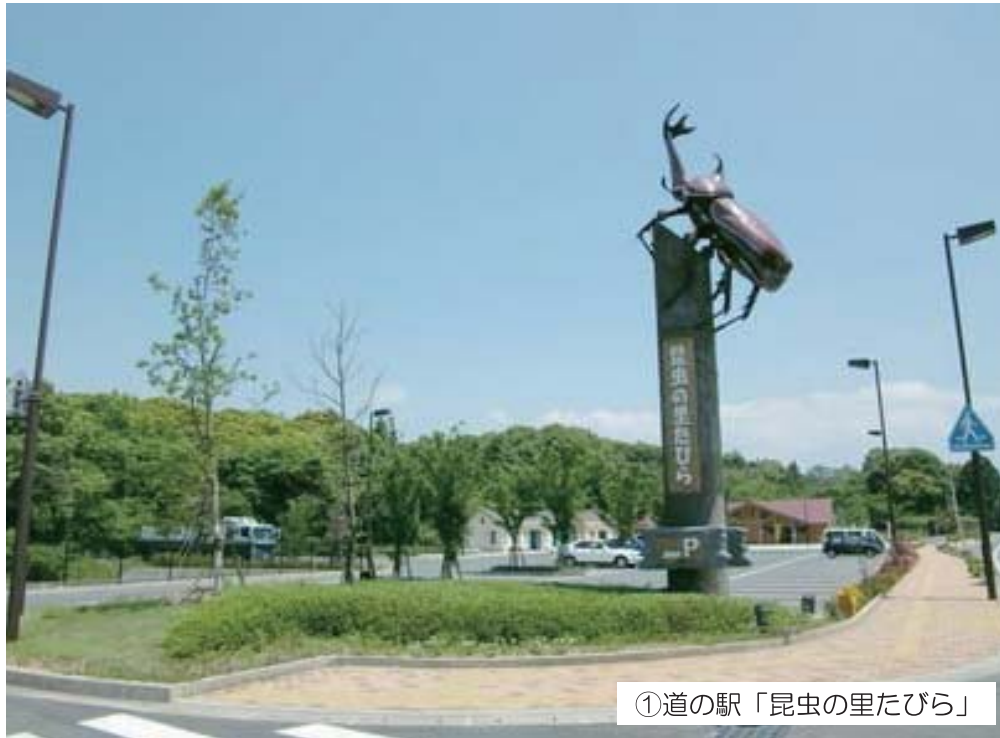
①道の駅「昆虫の里たびら」

平成13年にオープンした道の駅で、カブトムシの巨大モニュメントが目印です。町の物産品の販売や季節のイベント情報の発信なども行っています。観光パンフレットも置いてありますので、ぜひお立ち寄りください。