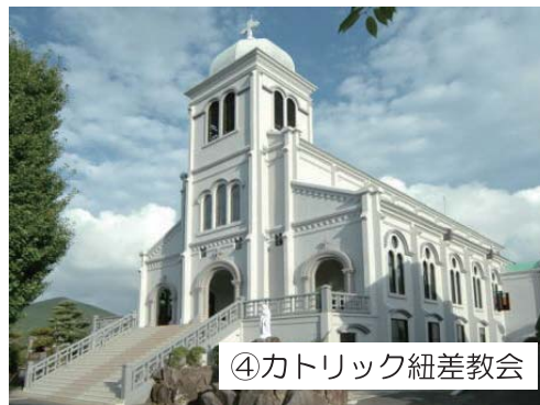
④カトリック紐差教会

黒島で洗礼を受けた宇久島の宮大工が1898年に建てたレンガ造教会。正面は一時白かったが、今は印象的な赤い色。側面のベランダも特徴的です。