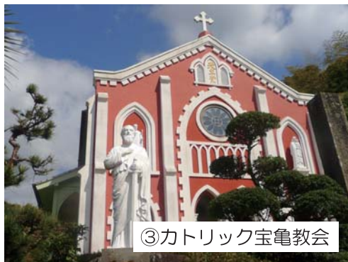
③カトリック宝亀教会

黒島で洗礼を受けた宇久島の宮大工が1898年に建てたレンガ造教会。正面は一時白かったが、今は印象的な赤い色。側面のベランダも特徴的です。