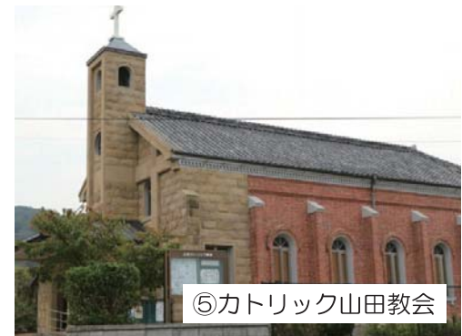
⑤カトリック山田教会

カトリック信徒、カクレキリシタン、仏教徒が混在する紐差に1885年、教会が建った。現在の教会は、鉄川与助によって1929年に建てられました。