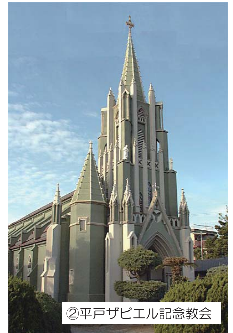
②平戸ザビエル記念教会

田平(たびら)教会は、1886年以降、黒島と出津(外海)から移住して来た信者が造り上げました。両地域とも潜伏キリシタンが多かったが、明治になってカトリックに復帰し、フランス人神父が常駐して教会も建てられました。教会は、平戸瀬戸を見下ろす高台に立地します。司祭館や門柱、石段、石垣などが残り、周囲には墓地や畑が広がるなど、歴史的環境がよく保存されており、2003年に国の重要文化財に指定されています。