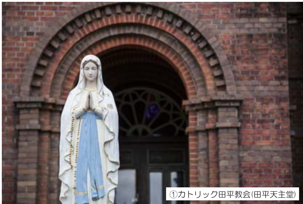
①カトリック田平教会(田平天主堂)

田平(たびら)教会は、1886年以降、黒島と出津(外海)から移住して来た信者が造り上げました。両地域とも潜伏キリシタンが多かったが、明治になってカトリックに復帰し、フランス人神父が常駐して教会も建てられました。教会は、平戸瀬戸を見下ろす高台に立地します。司祭館や門柱、石段、石垣などが残り、周囲には墓地や畑が広がるなど、歴史的環境がよく保存されており、2003年に国の重要文化財に指定されています。